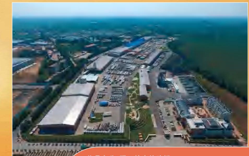
作品名称: 腾飞的中信路桥 拍摄地点: 哈尔滨市阿城区 中信公司在建设美丽中国,实现伟大“中国梦”的征程中,将不忘初心、砥砺前行。