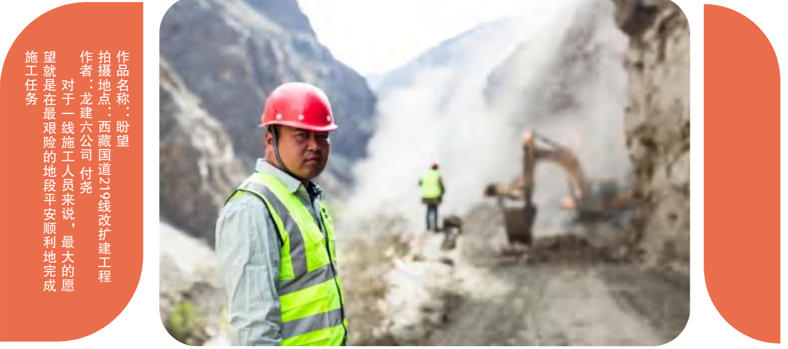
作品名称: 盼望 拍摄地点: 西藏国道219线改扩建工程 作者: 龙建六公司付亮 对于一线施工人员来说,最大的愿望就是在最艰险的地段平安顺利地完成任务

喜迎建国70周年,展现建投集团“抱一至永、远者无疆”的企业核心文化和“正心诚意、刚健自强”的守正坚韧奋斗精神,集团党委宣传部推出“我和建投共成长”书画、摄影、征文优秀作品系列展,用文艺的形式生动展现爱党、爱国、爱集团、爱建投的情怀。