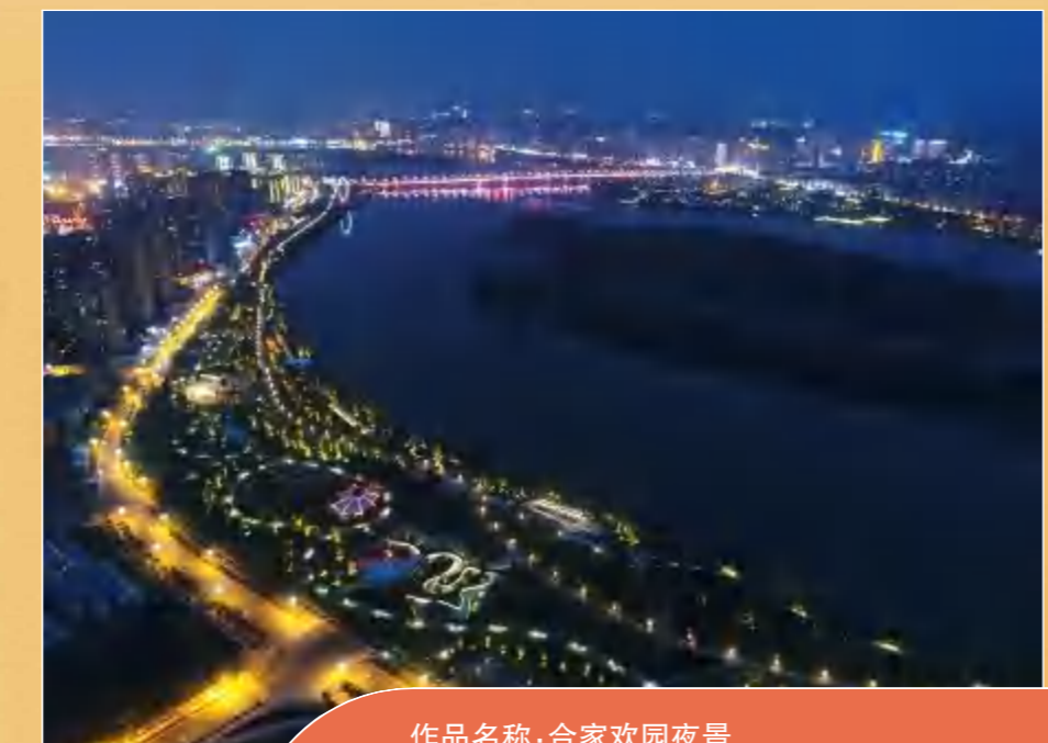
作品名称: 合家欢夜景 拍摄地点: 四川遂宁 建投集团走出去、拓市场,为省外基础设施建设添砖加瓦