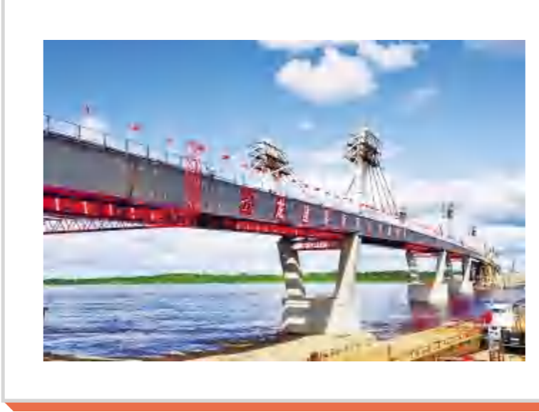
龙建一公司黑龙江大桥项目