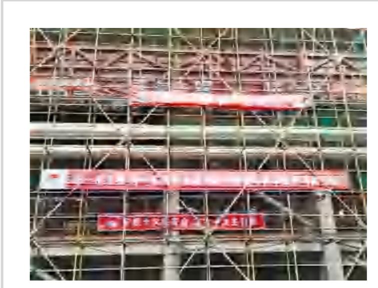
龙安四公司芜湖湖项目